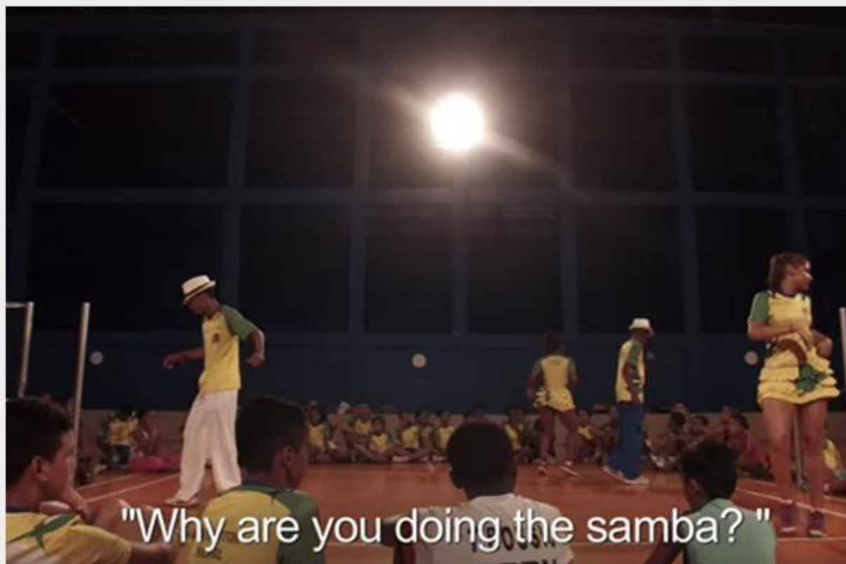
Cena do filme "Bad & The Birdieman", sobre a associação, que será lançado no Brasil na segunda quinzena de agosto .